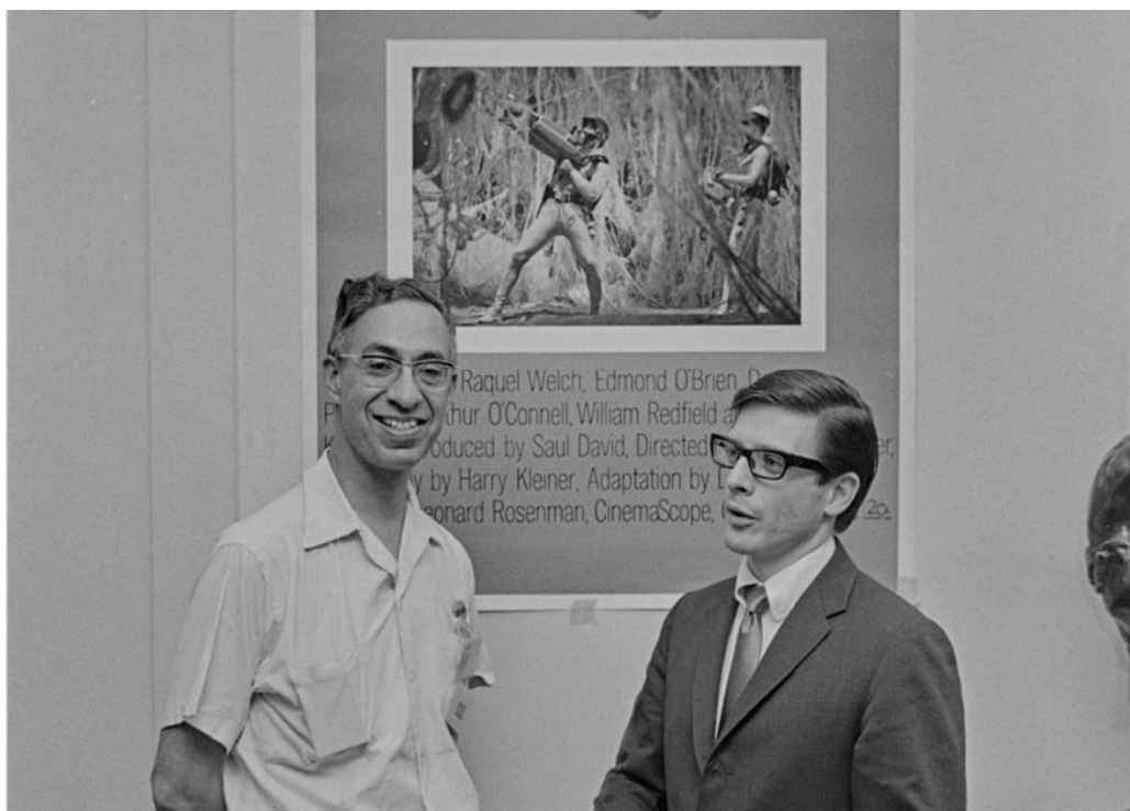
^Harlan Ellison con Donald Wollheim