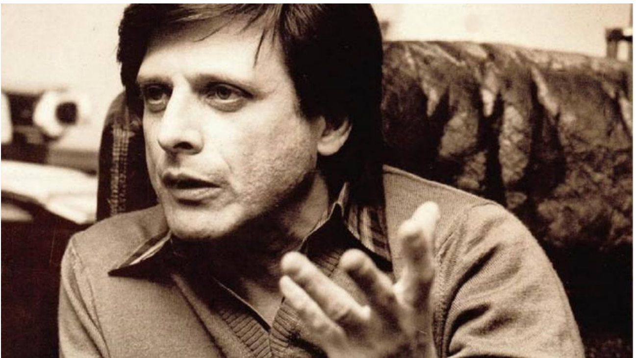
^Harlan Ellison (1934 - 2018)