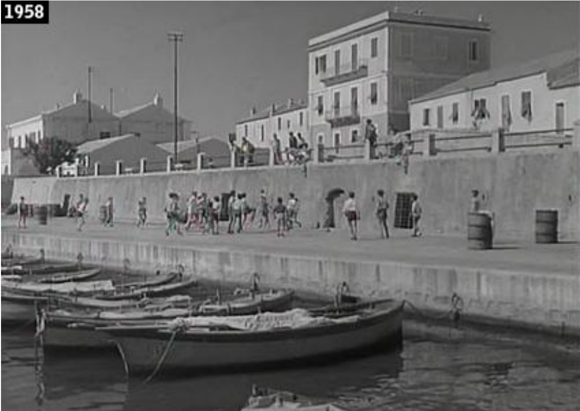
“Avventura nell’arcipelago” - La Maddalena: Location del film (1958)