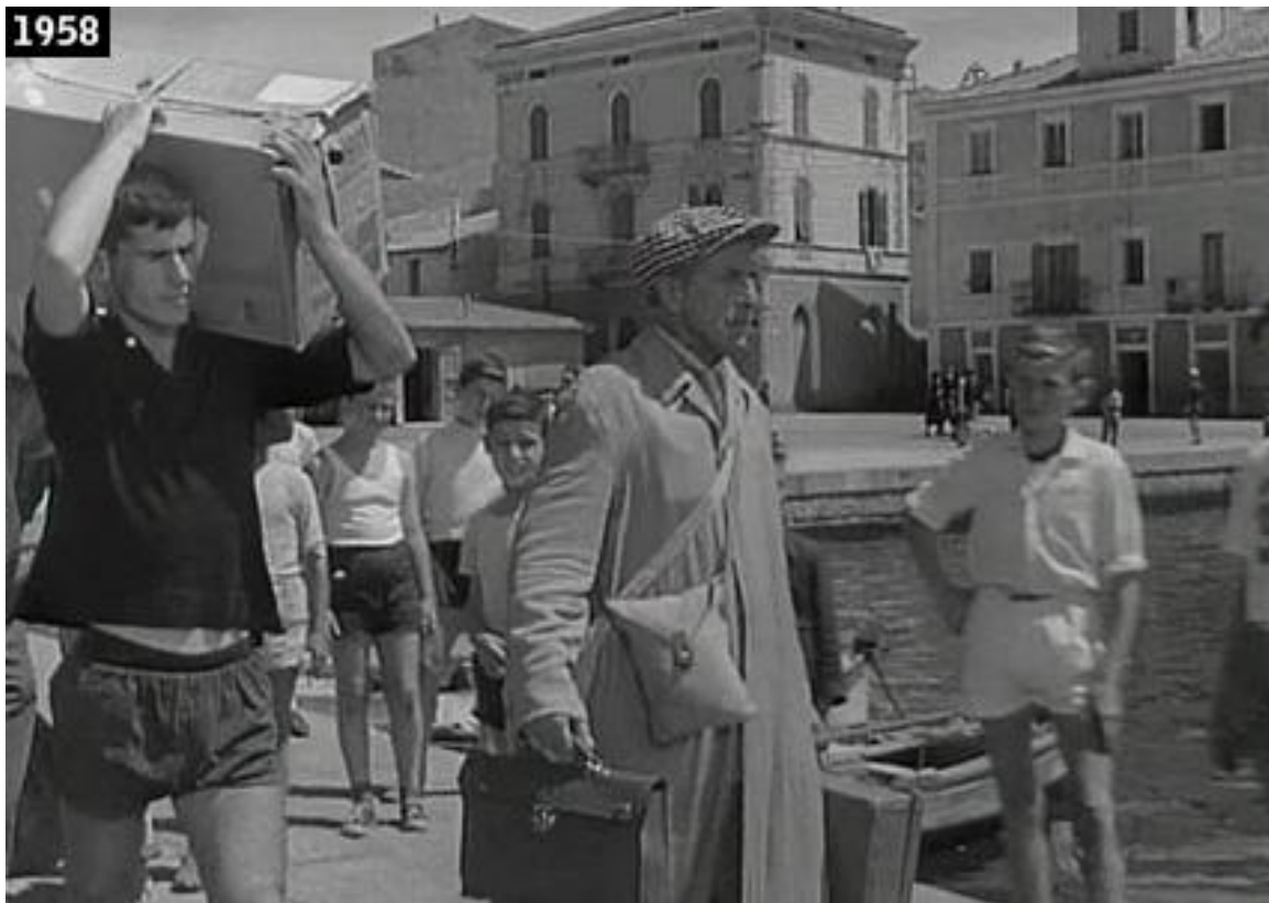
“Avventura nell’arcipelago” - Il Professore.