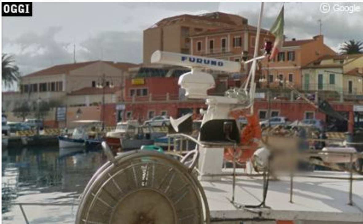
“Avventura nell’arcipelago” - Location del film (Oggi)