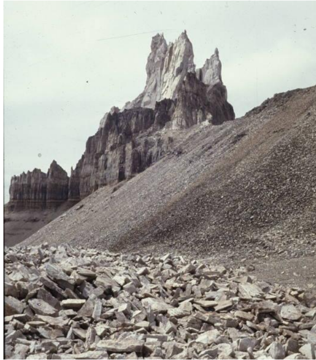
Cerro Astillado (Patagonia) "Torre Spagnoli"